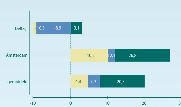
Figuur 1: Ontwikkeling in sportmomenten per week tussen 2022 en 2040 in procenten. * Het betreft COROP-gebieden Groot Amsterdam en Delfzijl en omgeving

In indexcijfers: 2022 = 100.